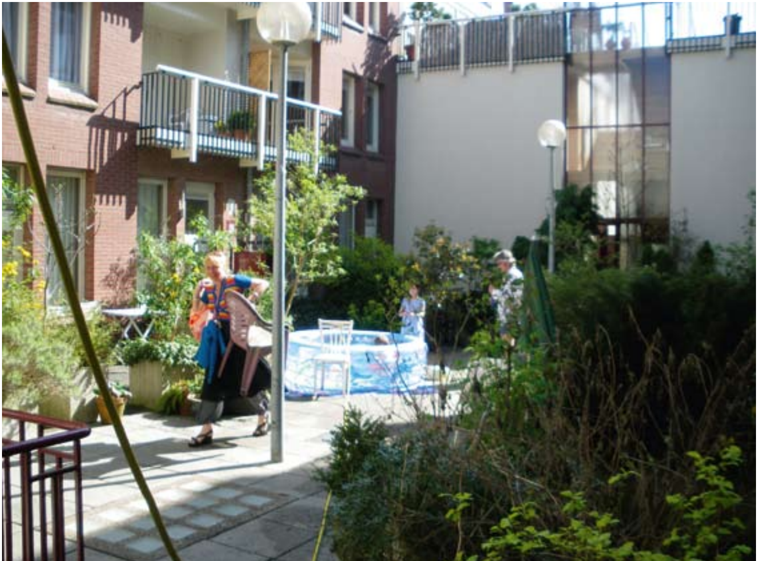
Onder: Amsterdam, entrepotdok. Semi-openbare tuinen op de eerste verdieping.