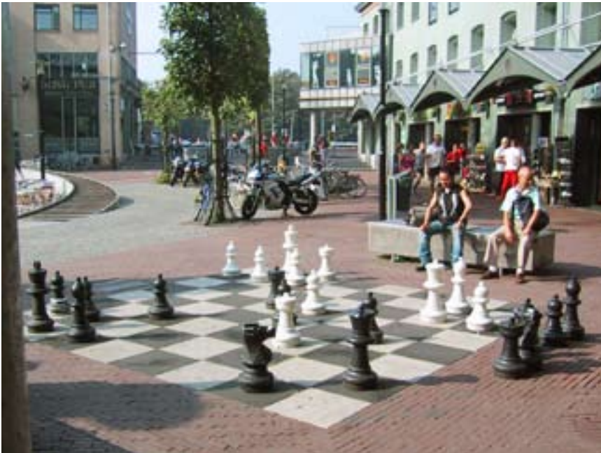
Boven: Amsterdam, groot schaakspel op het Max Euweplein. (foto: buro Witsenburg) Onder: Onverwacht waterpatroon. Het devies is fysiek en visueel 'ontharden': in kleur, materiaalgebruik, verlichting of activiteit. Een plek moet 'zacht' ogen om uitnodigend te zijn. (foto: buro Witsenburg)

Een deel van het bedrag dat Amsterdam toegewezen heeft gekregen, wordt besteed aan de inrichting van drie postzegelparken. De financiering en realisatie van de plekken zou echter niet alleen op het bordje van de gemeente moeten liggen, maar ook bij de overige partijen uit de buurt. Ook zij hebben belang bij de aanleg van de plekken. Daarnaast kan dan beter op de wensen en behoeften vanuit de buurt worden ingespeeld. Gezamenlijk kunnen gemeenten, corporaties, bedrijven, instellingen, scholen en bewoners in financiële zin maar vooral ook in de vorm van mankracht en materieel een bijdrage leveren. Een stichtingsvorm zou uitkomst kunnen bieden. Van belang is dat de organisatie herkenbaar is voor alle betrokken partijen in de buurt en zelfstandig kan functioneren. Een zelfstandige organisatievorm is bovendien heel belangrijk om subsidietoekenning door derden mogelijk te maken, bewoners een duidelijke rol te geven en het beheer van de plekken te waarborgen. Vandaar dat de voorkeur uitgaat naar een stichtingsvorm waarin vaste en roulerende afgevaardigden zitten als gelijkwaardige partijen.