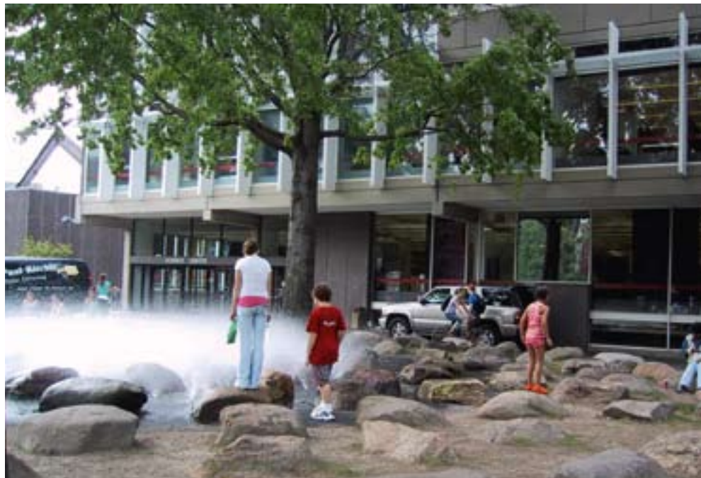
Boven: Boston, speelveldje bij Harvard University. (foto: buro Witsenburg) Onder: Amsterdam, terras op het dak van science center NEMO. (foto: buro Witsenburg)

het aanleggen van dit soort plekken te betrekken, komen deze ideeën aan het licht en kunnen dan tot uitvoering worden gebracht. In de Indische Buurt wordt er door de partijen gezamenlijk een uitvoeringsplan opgesteld om de postzegelparken te realiseren.